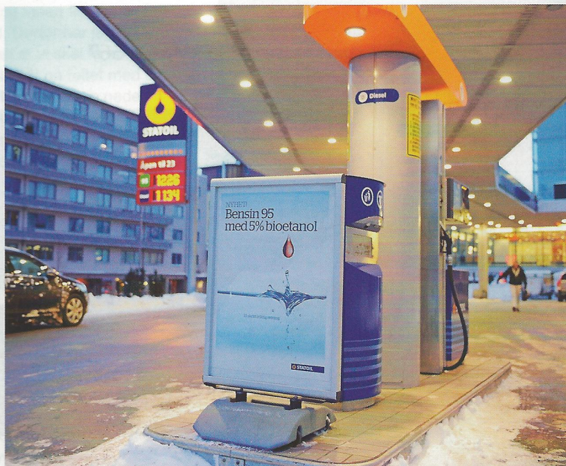
Målsettingen til Seaweed Energy Solutions er å omdanne tang og tare til bioetanol eller biogass. Bioetanol kan f.eks. brukes i bensin.

Blant de norske forskningsinstitusjonene har Sintef Fiskeri og Havbruk vært i tareteten, og deres viktigste industrielle samarbeidspartner har nettopp vært Sea-